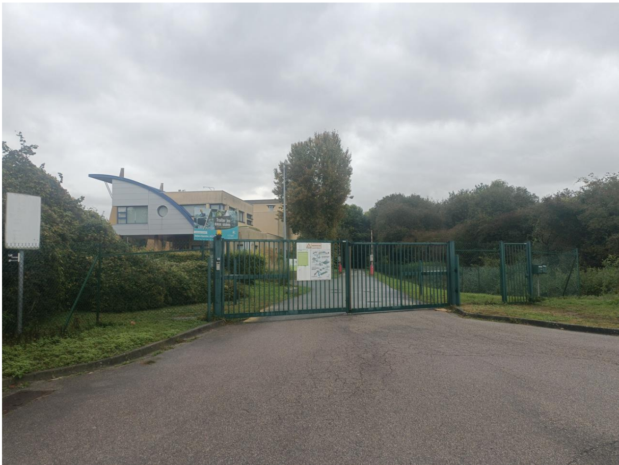
Figure 1 Entrée du chemin vert à proximité de la station d'épuration, octobre 2023